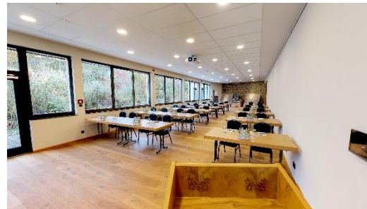
Seminarraum Ulrich, Gut Wöllried